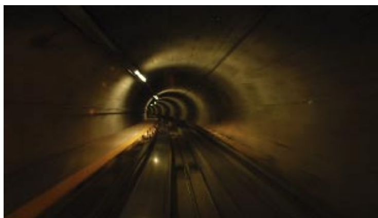
Brian Mc Kenna, From 2 to 1 and back to 2, video still, 2007