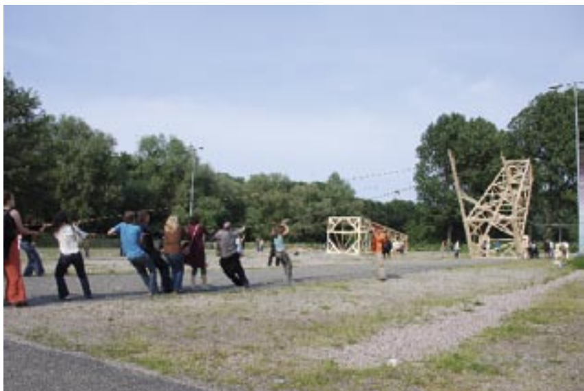
André van Bergen, Onedaysculpture, 2007, Vrije Ruimten Zuidas, (foto: Ron Zijlstra)

With these so-called 'onedaysculptures', Van Bergen concluded his artist-in-residency period in the Free Spaces of the Virtual Museum Zuidas and opened the similarly named exhibition. Along with five other artists, Bergen spent five months in the former St. Nicolaas Cloister in order to reflect upon the Zuidas in complete freedom. A catalogue describing this working period is available at the VMZ.