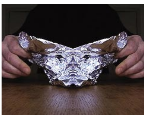
Michel François, Déjà Vu (Hallu), video stills, 2004