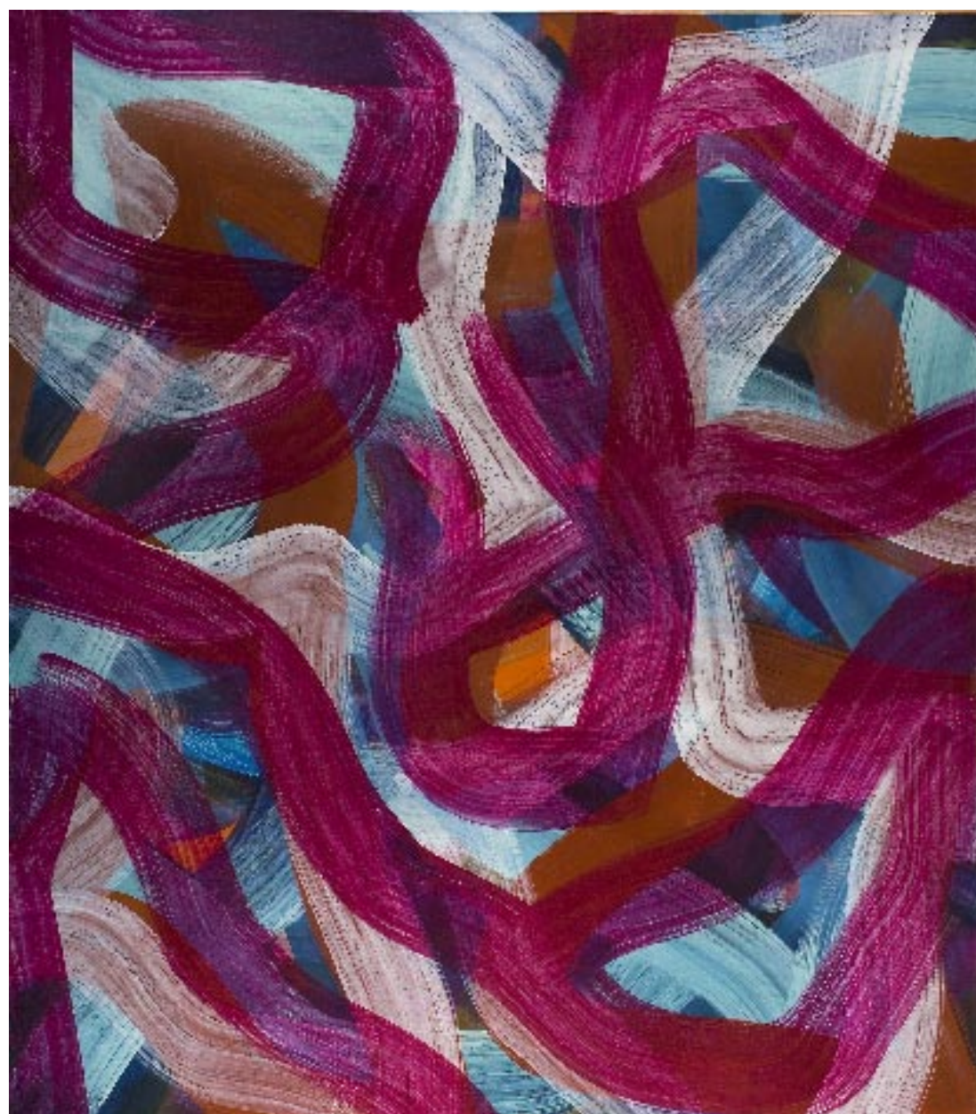
Robert Zandvliet, Zonder titel, 2002, collectie Akzo Nobel