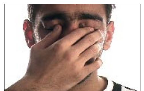
The Speculative Archive / Julia Meltzer and David Thorne, Not a matter of if but when: brief records of a time in which expectations were repeatedly raised and lowered and people grew exhausted from never knowing if the moment was at hand or was still to come, video still, 2006