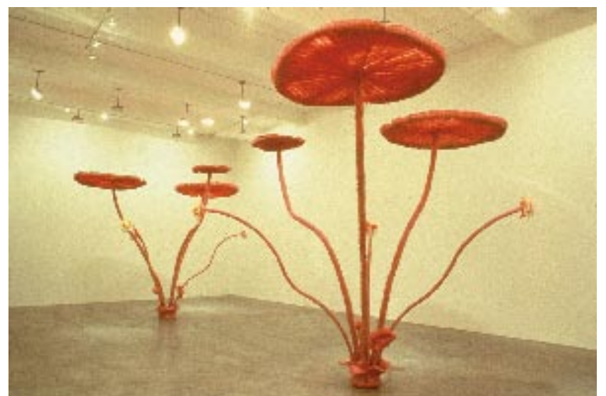
Keith Edmier, Victoria Regia (First night bloom), 1998, collectie Akzo Nobel