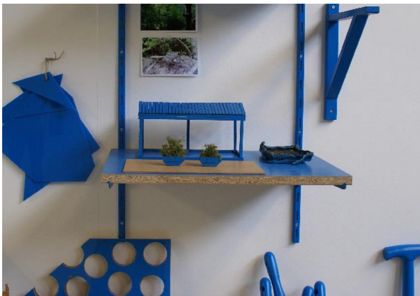
Frank Bruggeman, The Everywhere Tool Chest, detail installatie met schaalmodel, 2007

Zo wil hij Zuidas besmetten met kunst, hart en ziel geven aan het gebied en en passant de brutale kant van bedrijfscollecties voor het voetlicht brengen.