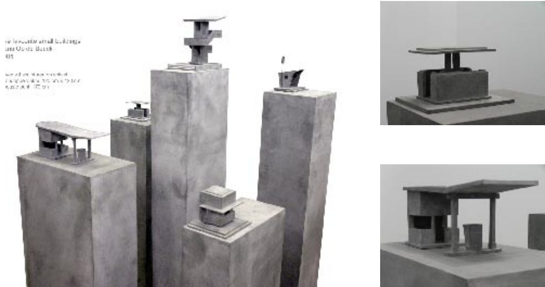
Hans Op de Beeck, My five favourite small buildings, 2005, collectie Akzo Nobel